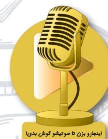
اینجا رو بزن تا سوتی‌شو گوش بدی