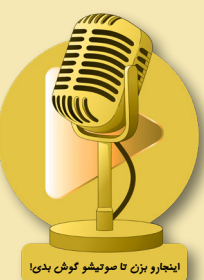
اینبارو بزن تا سوتیشو گوش بدی!