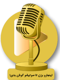
اینجا رو بزنی تا صوتشو گوش بدی!